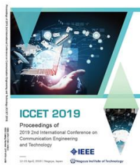
2019 | 名古屋 EI核心&Scopus