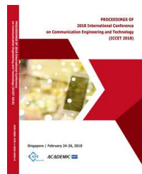
2018 | 新加坡 EI核心&Scopus